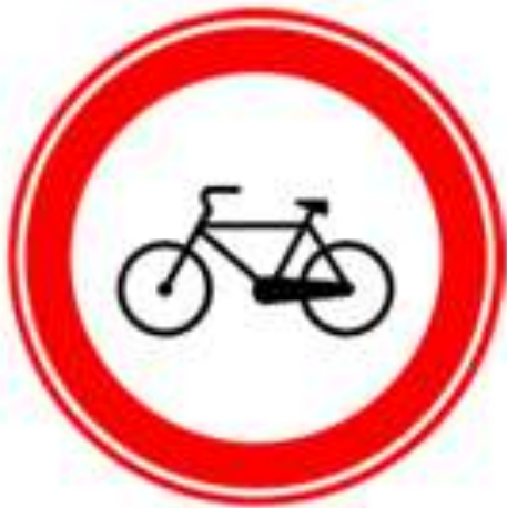
Движение на велосипедах запрещено