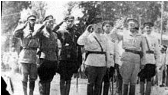
Воинское приветствие в РККА, 4-я армия, лето 1920 г.

В отличие от 1919 года, в 1920 г. Белое движение больше не имело контролируемых районов на территории европейской России, а силы РККА ( Рабоче-Крестьянская Красная Армия ) усилились многократно.