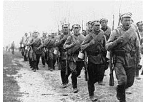
Стрелковое формирование РККА на марше 1920 г.