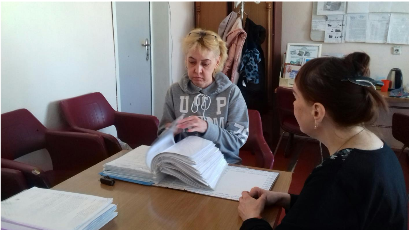
Подготовка к участию в республ. конкурсе на лучшую организацию работы по ОТ