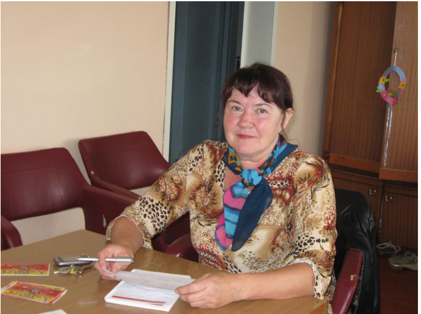
Собеседование в процессе внутреннего обучения по ОТ