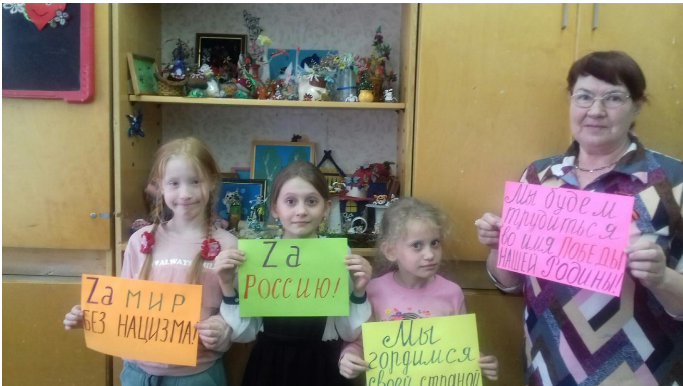
За мир без нацизма! Мы поддерживаем наших педагогов!